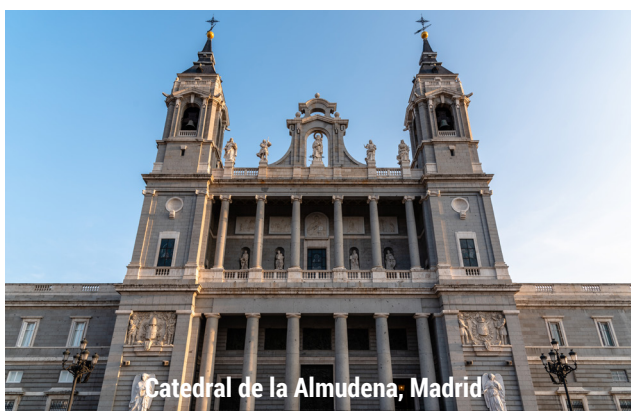
Catedral de la Almudena, Madrid