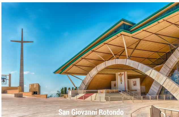
San Giovanni Rotondo